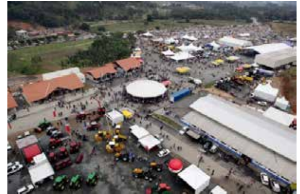
Festa do Colono em Itajaí Pg. 10

Cidade se prepara para novos tempos, com o projeto do engordamento da praia central, o Centro de Eventos, o BC Port, a maior Roda Gigante da América Latina, novas obras da Prefeitura e da iniciativa particular