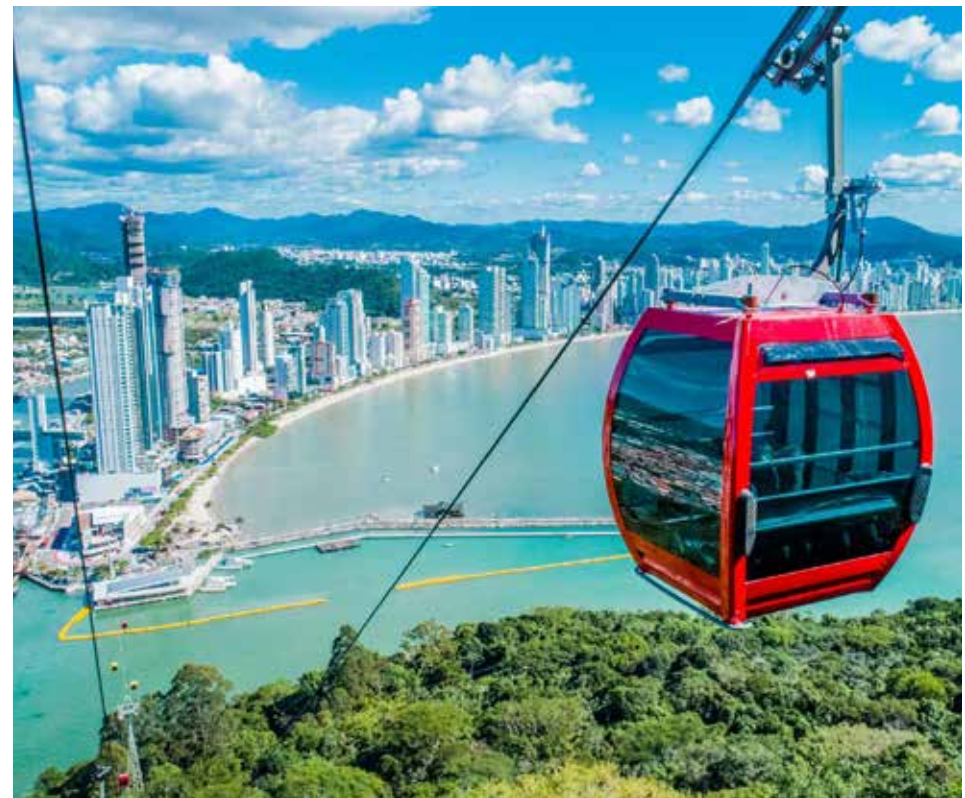
Parque Unipraias, uma das atrações