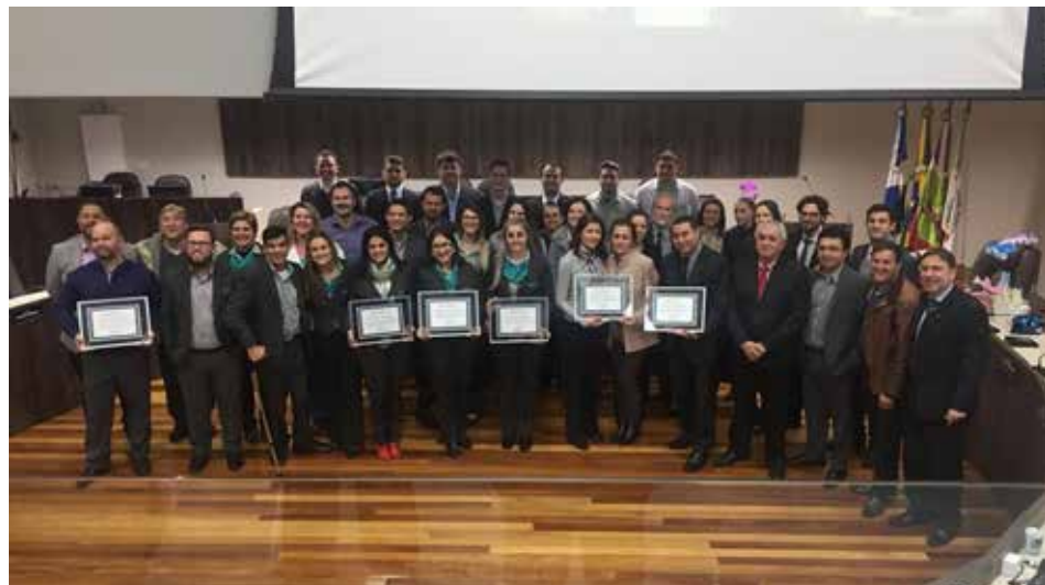
A homenagem na Câmara

A instituição conta com profissionais médicos qualificados na especialidade de clínica médica e cirúrgica, e uma equipe multidisciplinar que ultrapassa 300 funcionários. Estruturado num modelo