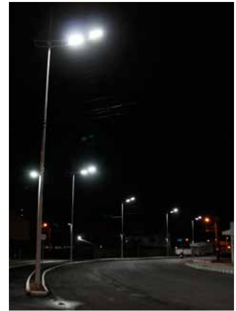
20 postes com luminárias de LED garantem uma iluminação perfeita no local

O Binário Sul tem um novo conceito de urbanidade, privilegiando as pessoas. Em razão disso, além das melhorias na mobilidade urbana com a construção de três pistas para veículos e ciclovia, foram criados mais de 2 mil m² de área verde que receberam uma academia ao ar livre, um parque infantil e um parque para cães - o primeiro da cidade. A COSIP está providenciando a iluminação para a academia ao ar livre, o parque infantil e o parque para cães