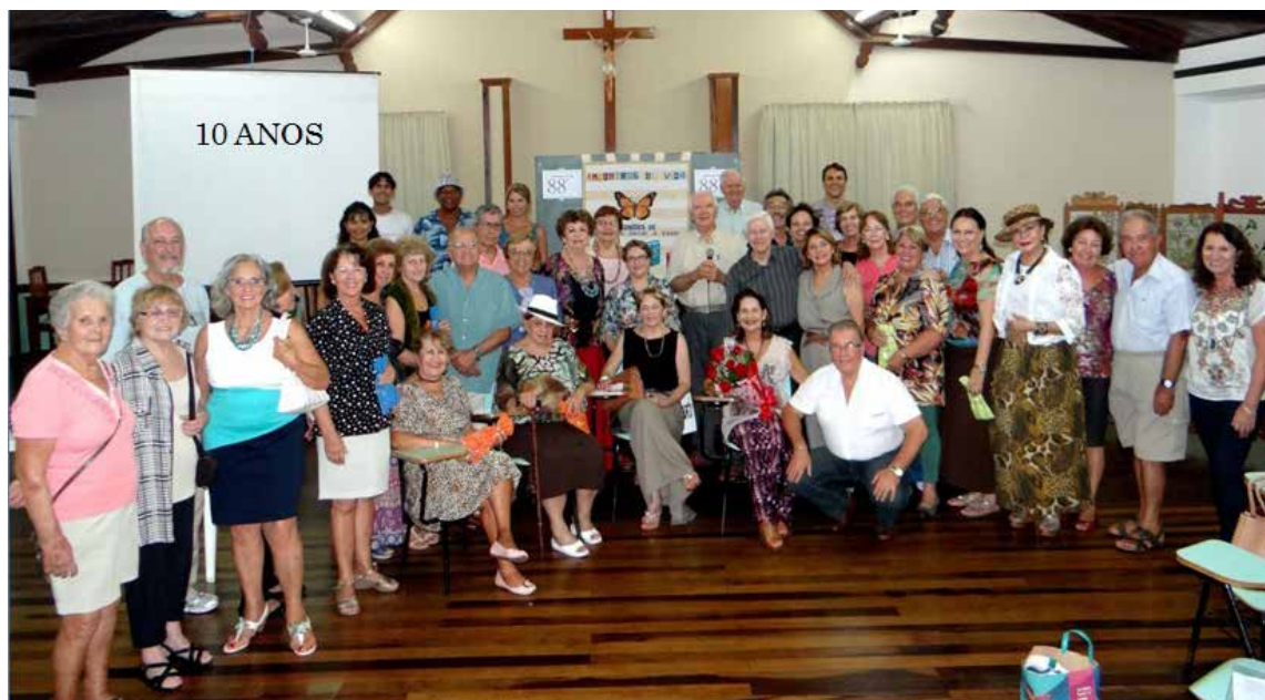
Grupo Encontros de Vida

Atualmente, no “54º” aniversário de nossa cidade dos Grupos que participamos com objetivo de valorização da saúde, citamos três: ADHBAC, Encontros de Vida e, QUALIVIDA. Embora, todos visem objetivo comum, apresentam aspectos distintos tendo surgido em diferentes datas e circunstâncias. Assim, nas comemorações de “20 de julho” podemos fazer um pequeno histórico desta contribuição à Saúde