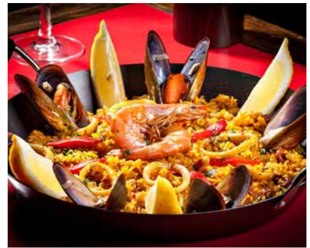
Uma grande atração, o Balneário Saboroso Pg. 08