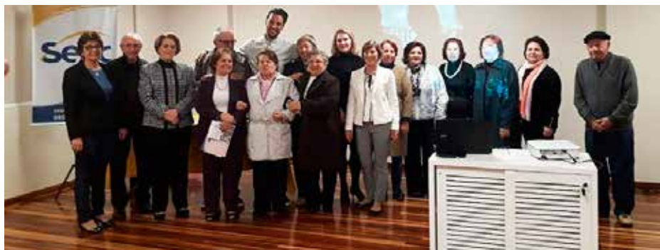
Formatura mais recente

A partir do desenvolvimento desses projetos os idosos organizaram o Primeiro Encontro Idoso Empreendedor “Debate” Acessibilidade, no qual foram convidados representantes do poder público e da sociedade civil para discutirem temas