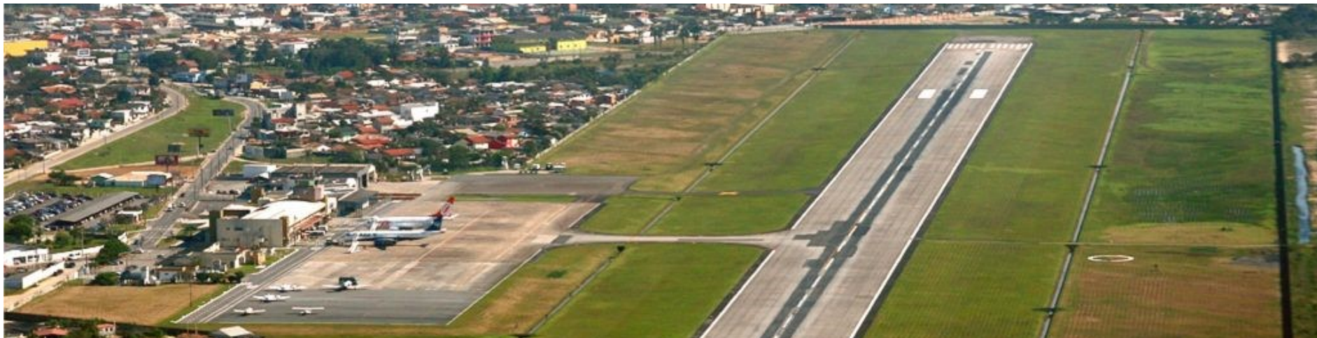
O terminal Ministro Victor Konder

madamente 1,6 milhões de passageiros utilizaram o Aeroporto Internacional de Navegantes, entre operações de embarques e desembarques. Em 2018, até o mês de agosto, foram aproximadamente 1,1 milhão de passageiros.