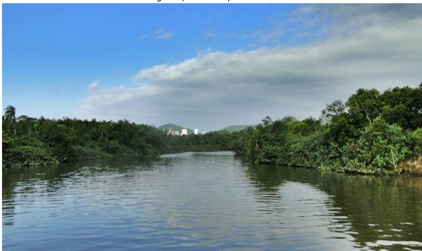
Rio Camboriú, importante demais para Balneário Camboriú e Camboriú

O Comitê de Gerenciamento da Bacia Hidrográfica do Rio Camboriú é um