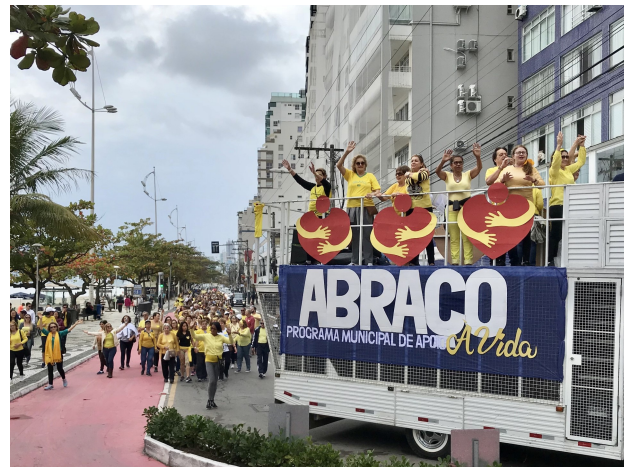
No lançamento do programa centenas de pessoas percorreram a Avenida Atlântica

28/09 - Sexta-feira: Audiência Pública convocada pela Câmara de Vereadores - debate sobre políticas públicas abordando a conscientização, prevenção e tratamento voltado aos motivos do suicídio; (transmissão pela TV Câmara). Horário: 18h30. Local: Câmara de Vereadores.