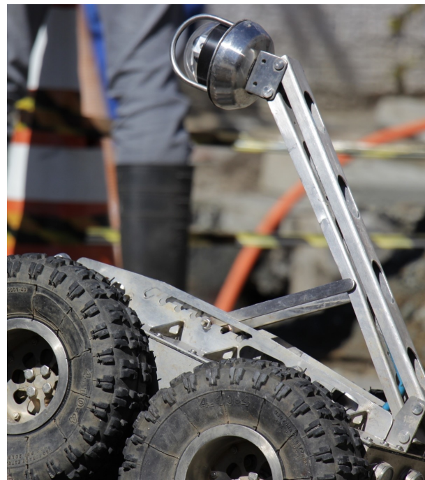
O valente defensor da Ecologia e Saúde

Reivindicação dos moradores há mais de 30 anos, a rede coletora de esgoto está funcionando desde dezembro na Praia de Laranjeiras. Atualmente, mais de 90% da população de Balneário Camboriú tem atendimento da rede coletora de esgoto. No Bairro dos Municípios estão sendo implantados 7,5 km de rede e nos bairros São Judas Tadeu e Barra mais 9,2 km. Em abril de 2017, foram entregues 20 km nos bairros Nova Esperança, Loteamento Shultz e Parque Bandeirantes.