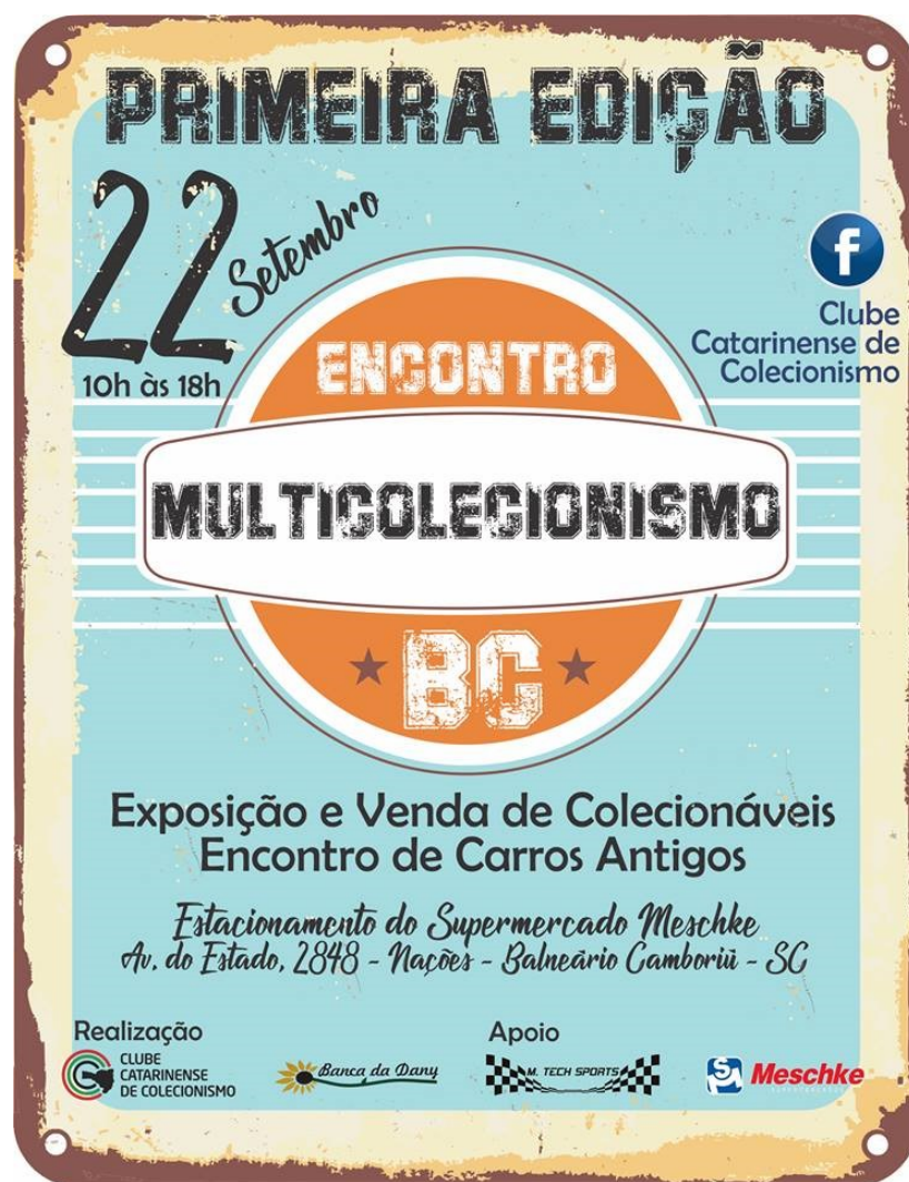
O cartaz do evento

MESA PEQUENA- 1,20 x 1,00 - R$ 20,00 (1 mesa)